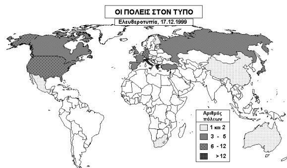
Σχήμα 2. Ο ελληνικός Τύπος είναι πολεογραφικός (σε διεθνές επίπεδο) μάλλον εσωστρεφής.

Στο παρουσιαζόμενο βιβλίο επιχειρείται μια σύμπλοκη (μεταμοντέρνα;) παρά συνθετική (ρυθμιστική;) θεώρηση του αστικού χώρου μέσα από την κριτική παρουσίαση, συμπάραθεση και ανάδειξη πληροφοριών, ιδεών και αφηγήσεων για την πόλη και τις πόλεις.