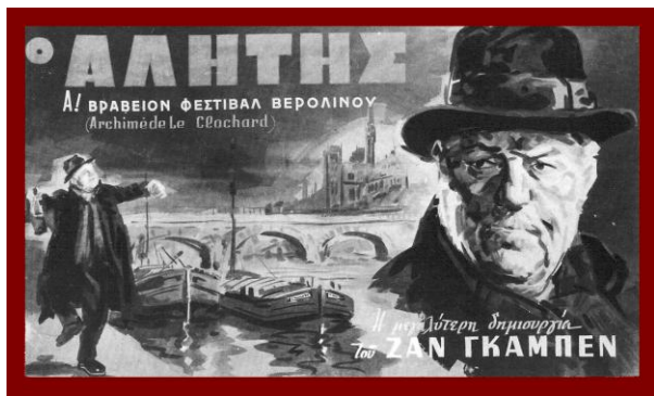
Σχήμα 3. Ο κινηματογράφος ως γεωγραφική τέχνη διαμορφώνει με τις γιγαντοαφίσες του το δρόμο της πόλης. Του Γ. Βακιρτζή.

(Σχ. 2) και τη γαλλική εφημερίδα Le Monde για να καταγράψει το κατά πόσο ο Τύπος αναδεικνύει ή όχι τις πόλεις της χώρας (του) και του κόσμου. Ο ελληνικός τύπος φαίνεται σχετικά εσωστρεφής αλλά με πλούσιο πολιτισμικό-πολεογραφικό υλικό. Είναι ενδιαφέρουσα εδώ και η παρουσίαση του National Geographic του οποίου η πολεογραφία είναι μεν εντυπωσιακή όχι όμως τόσο πυκνή όσο θα περίμενε κανείς. Σε όλα πάντως τα κείμενα του NG υπάρχουν «αράδες» πολύ φορτισμένες και φροντισμένες αστικογεωγραφικά. Ποιος θα περίμενε, για παράδειγμα, ότι μια από τις καλύτερες περιγραφές της πρωτεύουσας του Φιντέλ Κάστρο, της Αβάνας, θα βρισκόταν στο περιοδικό αυτό; Ο συγγραφέας του σχετικού άρθρου του NG (σελ. 45) προτείνει την περιχαράκωση ενός τετραγώνου στο χάρτη και τη λεπτομερή εξερεύνησή του, γύρω-γύρω. Ένα ωραίο μάθημα γεωγραφίας της πόλης.